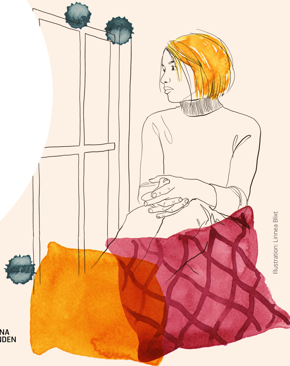
Illustration: Linnea Blixt